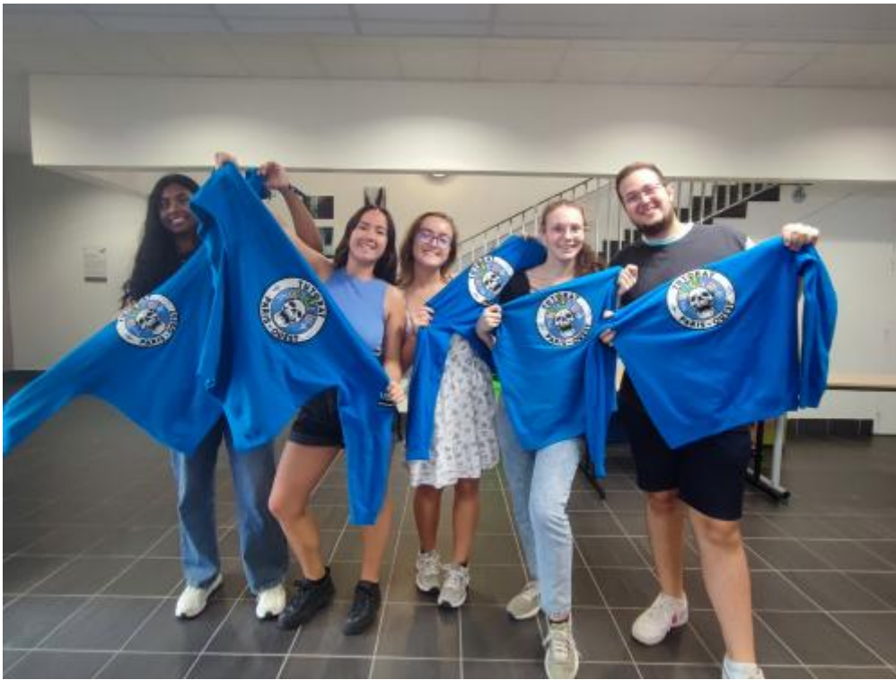
Le Tutorat de l'UFR Simone Veil - Santé à découvrir ici